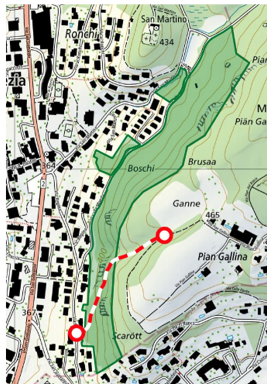
La tratta di sentiero sbarrata durante i lavori

Lo svolgimento dei lavori non pregiudicherà gli interventi di primo soccorso (ambulanza, polizia, pompieri), i cui Enti vengono informati separatamente.